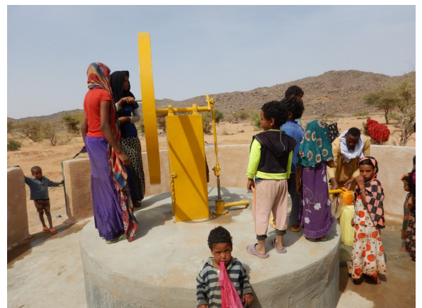
Puits financé par l'association « Les puits du désert »