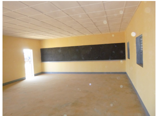
Nouvelle école financée par le Rotary Club et achevée en août 2020